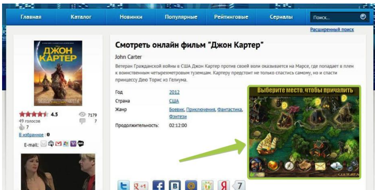
Screen1: баннер 300x250 в описании фильма

Примеры удачного размещения некоторых баннеров вы можете видеть ниже: